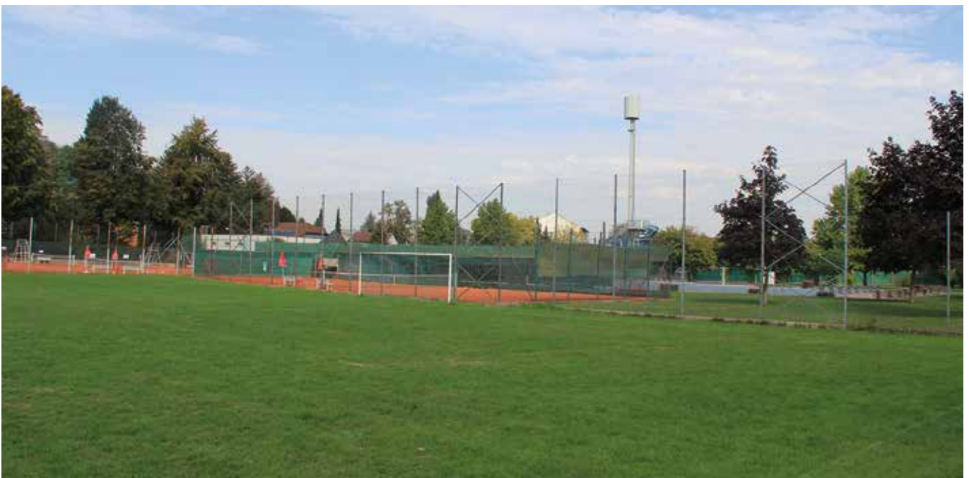
Auf diesem Foto sehen Sie, wo die Liegewiese des Freibads um ca. 2.500 m 2 erweitert werden soll.

Der Saunabetrieb ist von den geplanten Maßnahmen im heurigen Jahr noch nicht betroffen. Ob ein Betrieb in der Saison 2019/2020 stattfinden wird, ist derzeit noch offen.