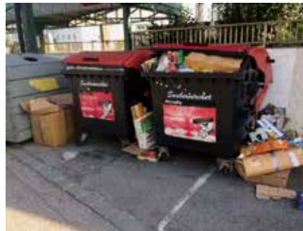
Die Sammelstellen für Altglas und Altpapier werden zu Mülldeponien!

Reparaturen an gemeindeeigenen Objekten werden von der Stadt Enns bezahlt, da dafür keine Versicherung aufkommt. Das heißt, dass Steuergelder für diese Instandsetzungen herangezogen werden müssen. Dasselbe gilt für die Reinigung der Abfall-Sammelstellen. Das Stadtamt Enns weist dar-