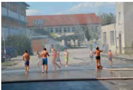
Die Kinder hatten reichlich Spaß!

Bei Kaiserwetter fand am 16. August der Beitrag der FF Enns zum Ferienspiel statt. Nach der Begrüßung und Vorstellung der FF Enns (im Feuerwehrhaus) gab es eine Führung durch die Fahrzeughalle. Anschließend konnten die Kinder ein kleines Holzfeuer im Hafen löschen, eine Bootsfahrt auf der Donau machen sowie Knacker und Marshmallows grillen. Auf dem Programm stand auch noch Metall-Schneiden mit dem hydraulischen Rettungsgerät, eine Fahrt mit der Drehleiter und eine kühlende Dusche, erzeugt mit dem Hydroschild.