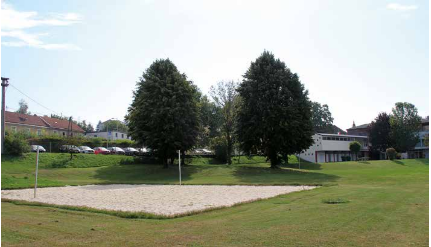
Hier soll das neue Kinderhaus entstehen.