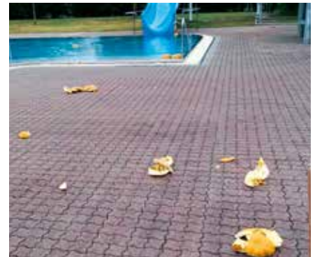
Nächtliche Besucher lösten im August im Freibad einen Reinigungseinsatz am frühen Morgen aus!

Wir ersuchen auch um entsprechende Hinweise aus der Bevölkerung. Danke!