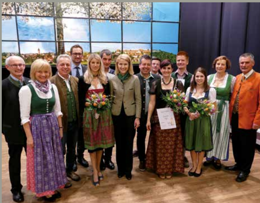
Die Preisträger

Stimmung machten die Plattlermädeln aus Wartberg an der Krems nicht nur mit ihrem traditionellen Schuachplattln, sondern auch mit ihren Showeinlagen.