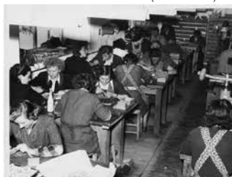
Werkstatt in Enns-Neugablonz