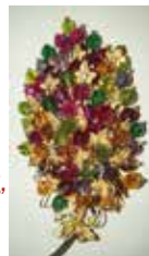
Schmuckstück aus Enns (ca. 1960)

Veranstalter: Sudetendeutsche Landsmannschaft