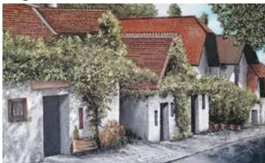
Heinz Stockinger: Kellergasse Haugsdorf

H einz Stockinger: Bilder aus Mineralien – gestaltet aus Quarz, Turmalin, Serpentin, Kalkstein und anderen Mineralien. Mein Bestreben ist es, die Farben der Mineralien so einzusetzen, dass die natürliche Beschaffenheit der Steine in ihrer reinsten Weise zur Geltung kommt.