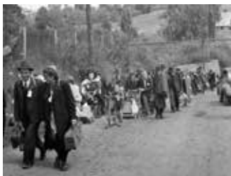
Vertreibung aus der Heimat