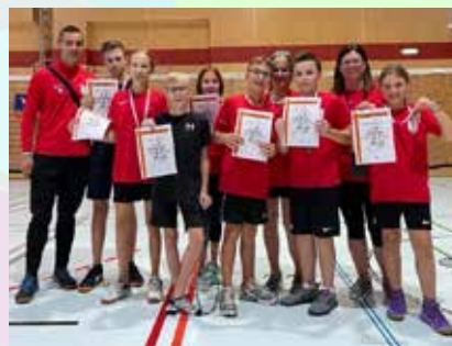
OÖ Schüler-Mannschafts-Meisterschaften 2021

spielt in Paaren – das nennt man Doppel. Die Spieler*innen spielen den Ball so über das Netz, dass dieser entweder im gegnerischen Spielfeld auf den Boden kommt, die Gegner*innen ihn nicht über das Netz zurückschlagen können oder sie den Ball ins Out schießen. So werden beim Badminton die Punkte gemacht.