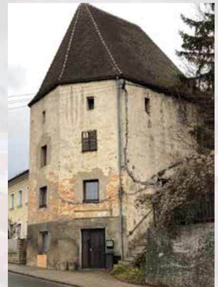
Der Lederer-Turm war ein Magazin für Waffen und Schießpulver zur Verteidigung der Stadt.