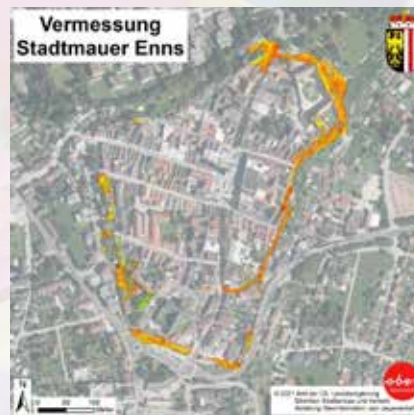
Gelb eingezeichnet ist die bisher erforschte Stadtmauer Grafik: Abt. Geoinformation Land OÖ

Das Baumaterial lag fix und fertig vor der Stadt: Man hat