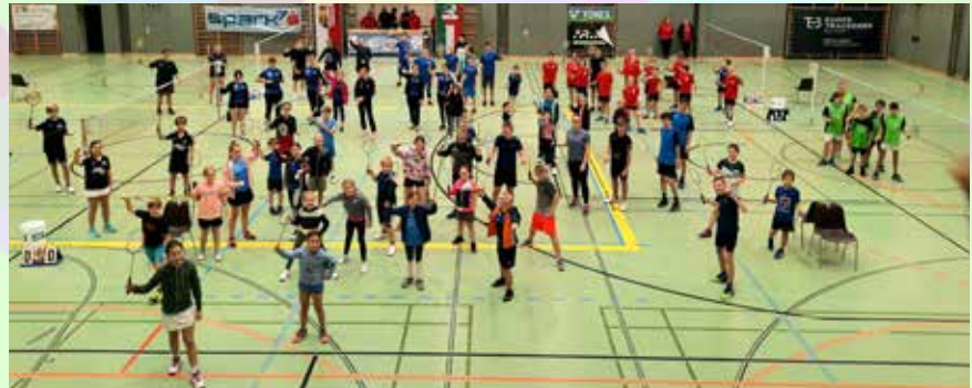
OÖ Nachwuchs-Landesmeisterschaften 2021

Viele Leute glauben, dass Badminton dasselbe ist wie Federball. Da liegen sie knapp daneben. Federball spielt man in der Freizeit, dabei versucht man den Ball so oft wie möglich hin und her zu schlagen. Badminton hingegen ist ein Wettkampfsport mit so einigen Spielregeln. Für den Sport braucht jede/r Spieler*in einen Schläger, einen speziellen Federball und ein Spielfeld, das mit einem Netz in zwei Spielhälften geteilt wird. Beim Badminton können entweder einzelne Spieler*innen gegeneinander spielen – im sogenannten Einzel, oder man