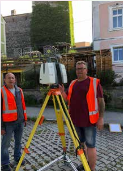
Vermessungs-Techniker des Landes OÖ. bei der Arbeit in der Dr. Renner-Strasse vor dem Pfaffenturm