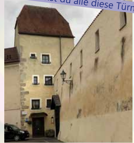
Judenturm in der Kaltenbrunner-Gasse mit Teil der Stadtmauer