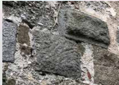
Alte „Römersteine“ wurden beim Mauerbau wieder verwendet.

einfach die gut behauenen Quader-Steine vom römischen Lager Lauriacum dafür wiederverwendet. Ein gutes Beispiel für Wiederverwertung oder Kreislaufwirtschaft!