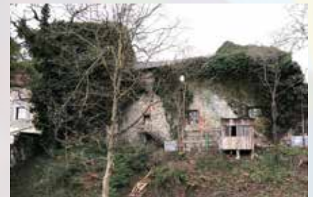
Der "Grüne Turm" an der Stadtmauer wird mühsam vom Efeu befreit.