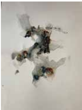
Clemens Schreiberhuber: o. T. (Herbststringen) Acryl mit Wasser auf Papier