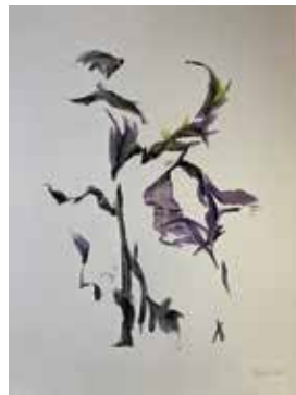
Elisabeth Schreiberhuber: o. T. (Pärchen) Acryl auf Papier