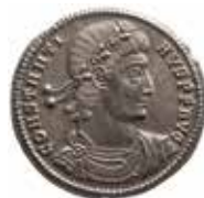
Miliarensis von Constantius II, datiert 337– 340 n.Chr.