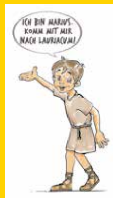
Grafik: M. Gletthofer