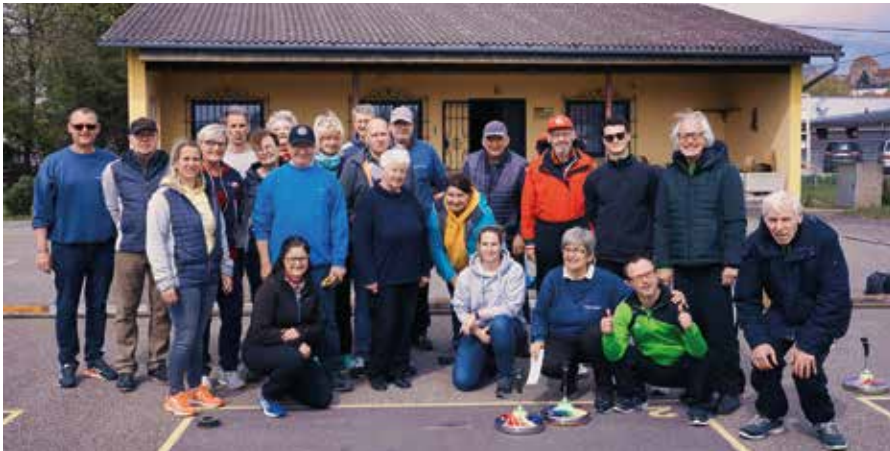
Die teilnehmenden Mannschaften

Am 23.04.2022 wurde mit der Lebenshilfe Steyr-Gleink ein Freundschaftsturnier ausgetragen.