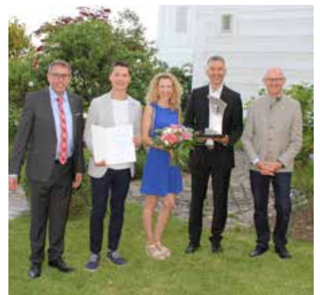
Wirtschaftspreis: Drogerie Pfeiffer