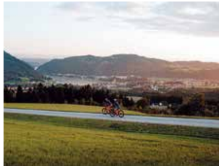
Radtour am Donauradweg mit Blick auf Grein

Die 15 neuen Touren umfassen insgesamt 700 Radkilometer. Die Radrunden werden als R1.01 bis R1.15 bezeichnet, orientieren sich also am Donauradweg R1, und sind mit Wegweisern des Landes Oberösterreich offiziell beschildert. An allen Startpunkten finden sich Startplatztafeln mit wichtigen Informationen, Karten zur Tour und weiterführenden Hinweisen zum angrenzenden Radnetz