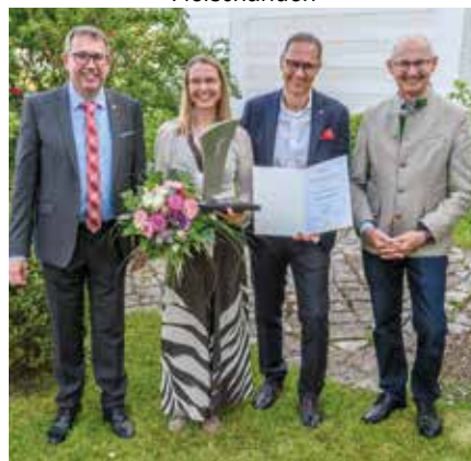
Wirtschaftspreis: Firma Langer