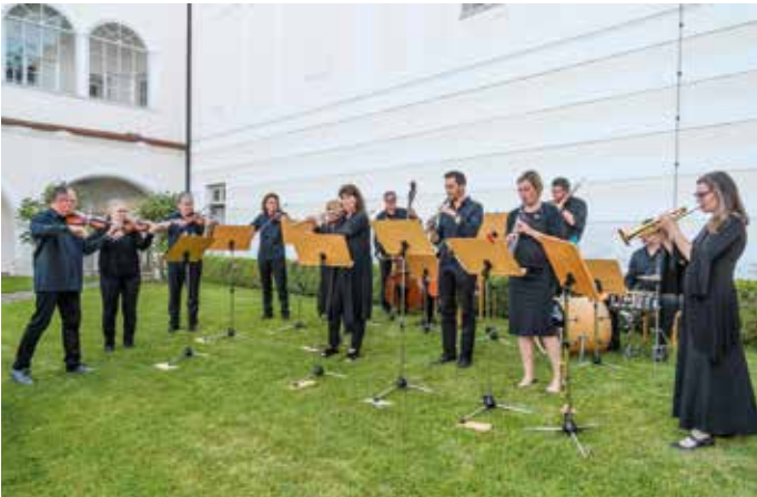
Orchester collegium ennsegg