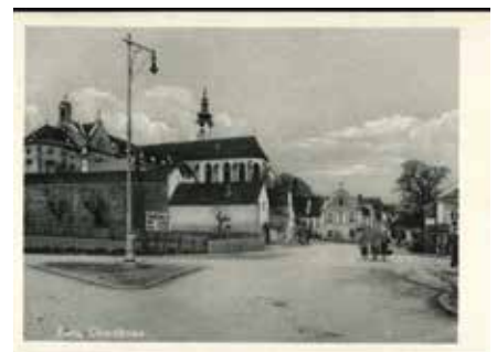
Ansichtskarte aus dem Jahr 1942 – an dieser Kreuzung führten die Todesmärsche vorbei. 2022 wird hier ein Denkmal errichtet.

Nähere Informationen finden Sie unter enns@mkoe.at .