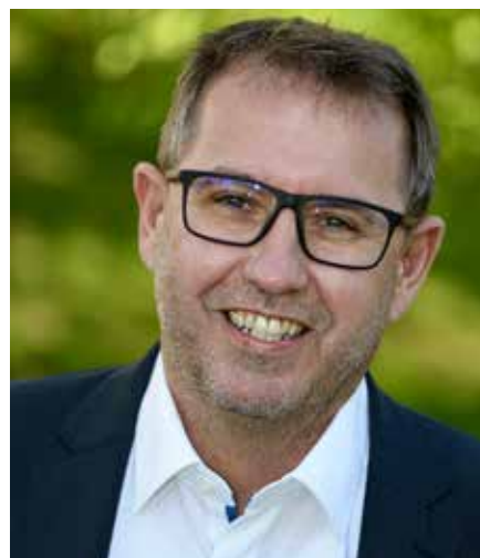
Bürgermeister Christian Deleja-Hotko:

„Mit der Community Nurse schaffen wir einen leichteren Zugang zu Informationen zu Gesundheits- und Pflegefragen auf kommunaler Ebene und hoffen damit, den Menschen noch länger ein eigenbestimmtes Leben trotz mancher gesundheitlichen Einschränkungen zu ermöglichen.“