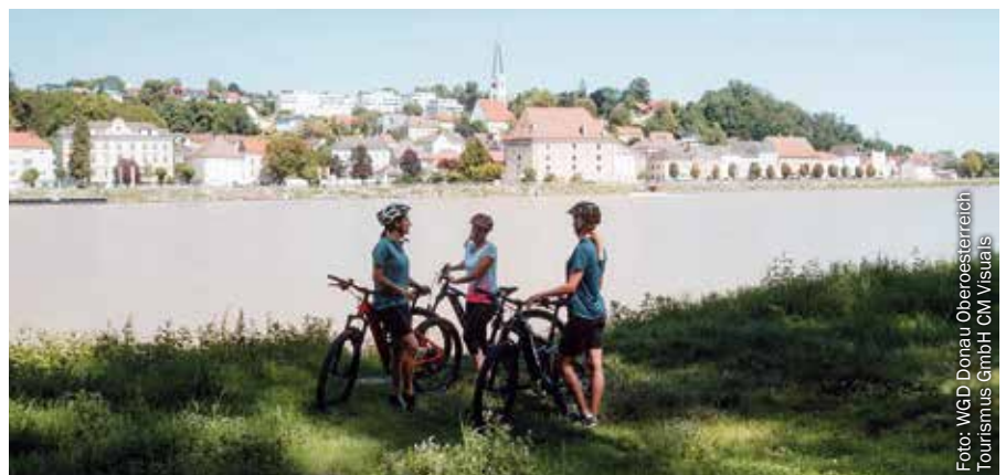
Radfahrerinnen mit Blick auf Mauthausen

Und so geht's: Einfach unter www.donauregion.at/radverleih den gewünschten Standort, den Tag, die Zeit und das E-Bike auswählen und im Warenkorb