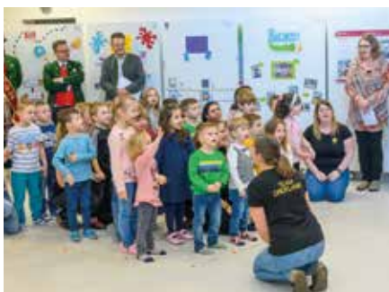
Die Kinder des Kinderhauses erfreuten die Gäste mit einem Willkommenslied und dem Dreiklang-Song.