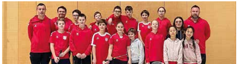
Das Ennser Schüler*innenteam mit seinen Trainern beim letzten OÖBV-Nachwuchs-Turnier in Vöcklabruck.

Das nächste OÖ Nachwuchs-Turnier (ABC-Nachwuchs-Rangliste OÖ) in der Sporthalle findet am Samstag, 25. Mai 2024, ganztägig in der Sporthalle statt!