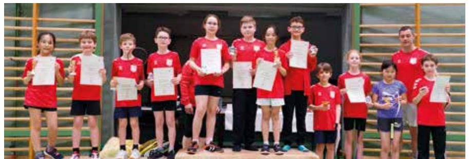
Sieger*innen des Kids-Bewerbs