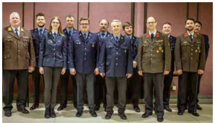
Die am weitesten angereisten Abordnungen der Feuerwehren Sossau und Dingolfing aus der Partnerstadt Dingolfing in Bayern.