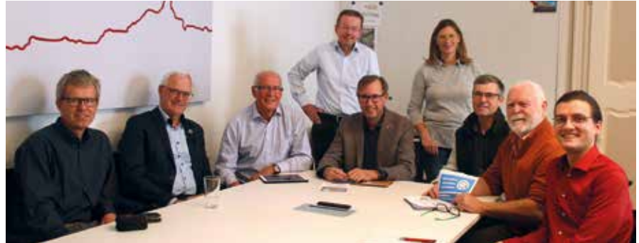
Vorstellung des EEG Enns Konzepts am Ennser Stadttamt

Die EEG Enns ist ein gemeinnütziger Verein mit ehrenamtlichen, engagierten Mitgliedern. Sie ist überparteilich und verfolgt das Ziel der Energiewende in Enns. Durch die Förderung dieser Energiegemeinschaften in Österreich