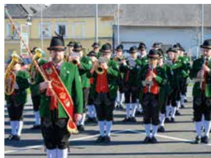
Für die weitere musikalische Umrahmung sorgten die Mitglieder des Musikvereins Stadtkapelle Enns.