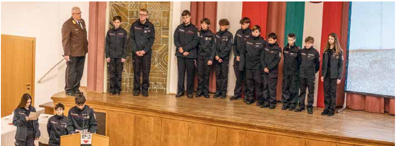
Die Jugendgruppe wurde vor den Vorhang geholt!