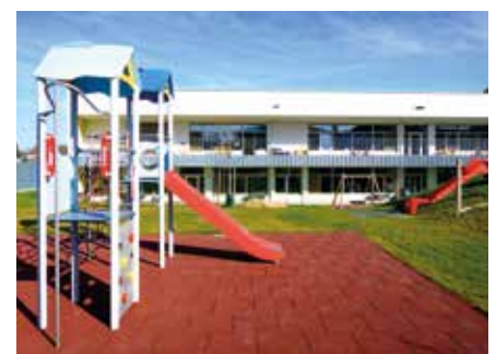
Nach der Segnung durch Pater Mag. Czeslaw Sikore erfolgte eine Führung durch die Gruppenräume, in denen die Pädagoginnen über das Konzept des Kinderhauses sprachen.