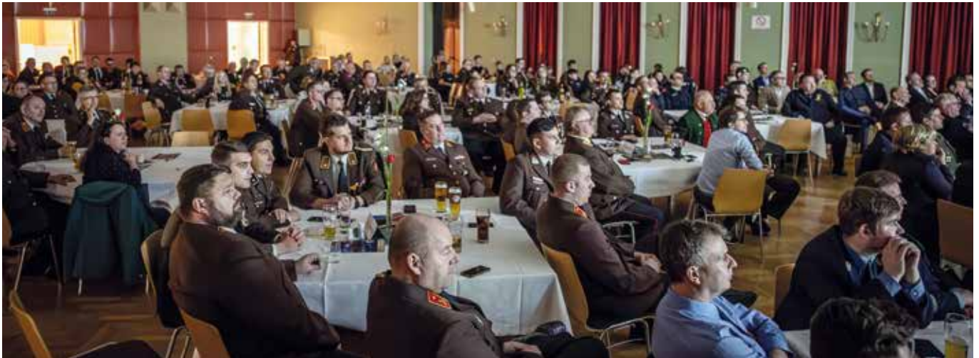
Der Einladung folgten viele Mitglieder, Ehrengäste und Freunde der Feuerwehr Enns.