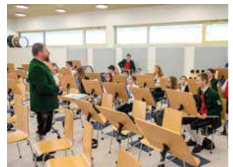
Beeindruckende Akustik im neuen Orchesterraum mit dem Jugendorchester der Stadtkapelle.