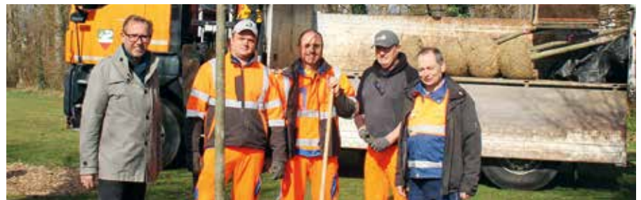
Bürgermeister Christian Deleja-Hotko freut sich über die neuen Bäume im Schlosspark, die die alten, kranken Linden, die entnommen werden mussten, ersetzen.

Außerdem wurden 40 junge Buchen aus natürlicher Vermehrung vom Schlosspark in den Eichbergwald verpflanzt.